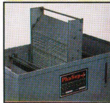
Compact CPS-Jr. Separator Tank (1 GPM)